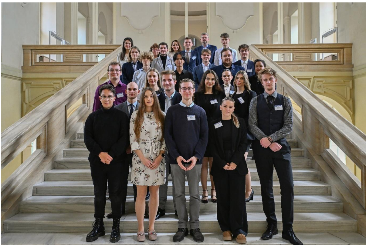
Studenti – velvyslanci kariéry v EU na školení konaném na MZV, 15. 10. 2024

DA MZV rovněž finančně podpořila osm účastníků dalšího běhu kurzu „Gateway to the EU institutions“. Ve spolupráci s organizátory, Univerzitou Karlovou a Vysokou školou ekonomickou, se podílela na výběru stipendistů, kteří tak budou moci kurz v první polovině roku 2025 absolvovat bezplatně.