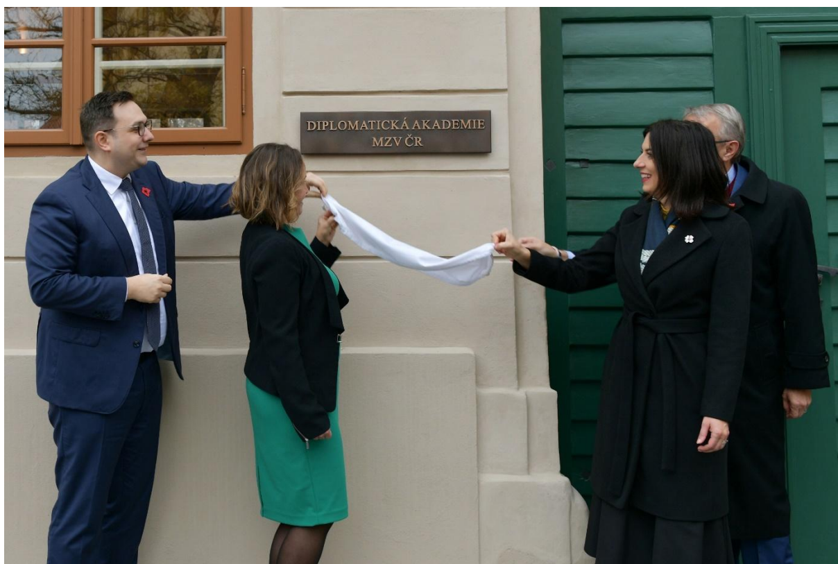
Slavnostní inaugurace DA MZV, 7. 11. 2024

Ministr zahraničních věcí Jan Lipavský 7. 11. 2024 slavnostně inauguroval DA MZV. Formálního zahájení její činnosti se zúčastnila také předsedkyně Poslanecké sněmovny Parlamentu ČR Markéta Pekarová Adamová, ministr pro evropské záležitosti Martin Dvořák a zástupci dalších institucí státní správy.