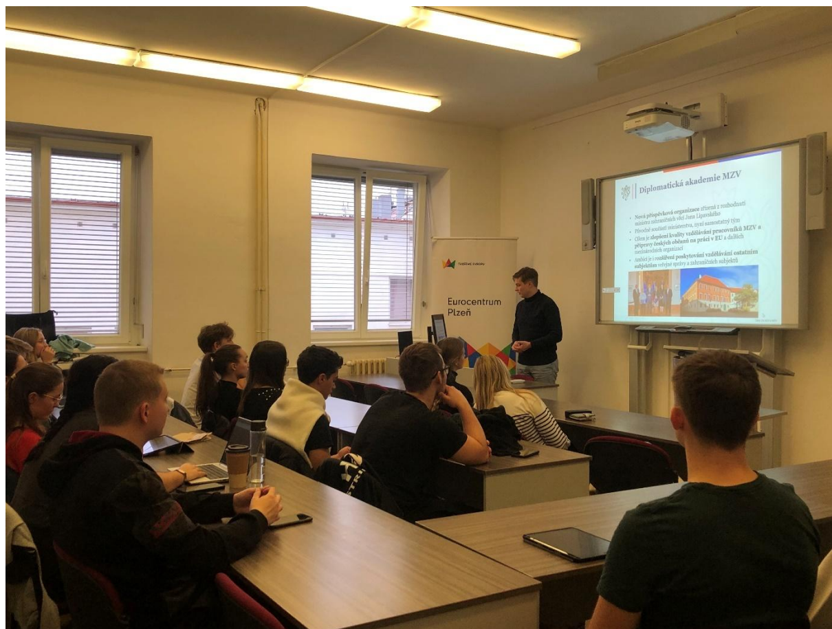
Prezentace DA MZV v rámci workshopu Práce a stáže v evropských institucích v Plzni, 12.11.2024

institucích a české diplomacii. Přestože se jednalo o pilotní běh, účast předčila očekávání (průměrně 40 studentů na akci) a workshopy byly pozitivně hodnoceny všemi zúčastněnými.