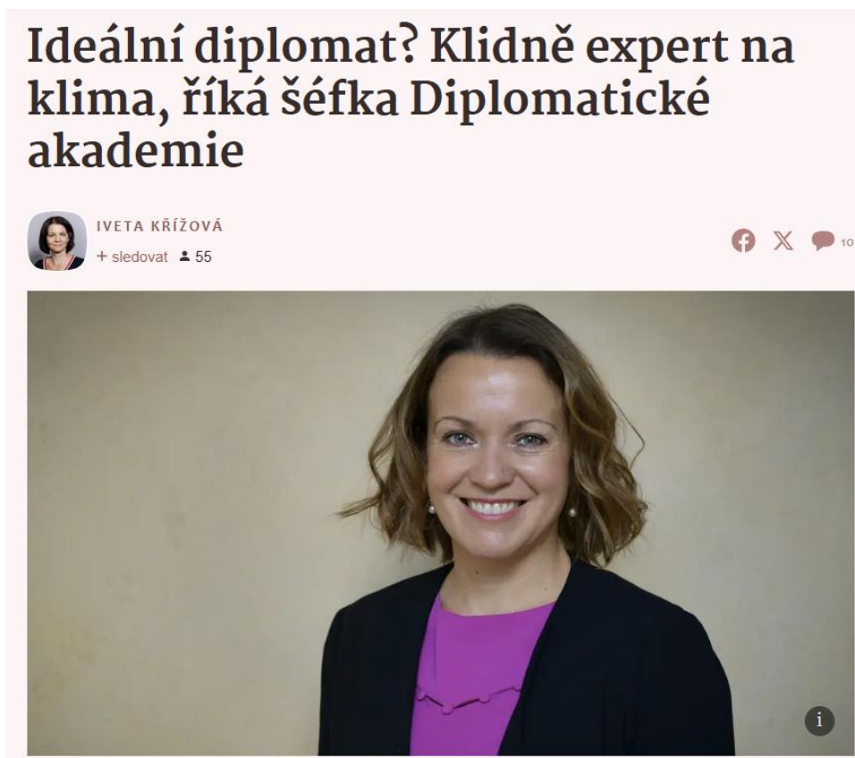
Rozhovor s ředitelkou DA MZV pro Seznam Zprávy, 26. 11. 2024