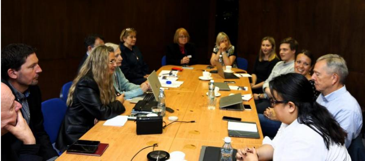
Společné setkání IVS a DA MZV ve vzdělávacím středisku IVS v Benešově, 7. 5. 2024

a Česká rozvojová agentura), ale také s CzechTrade, agenturou na podporu exportu zřízenou Ministerstvem průmyslu a obchodu či s Institutem pro veřejnou správu Praha (IVS), který je zřízen Ministerstvem vnitra a mj. poskytuje vzdělávání úředníkům územních samosprávných celků.