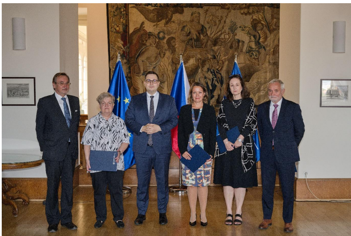
Slavnostní jmenování členů Vědecké rady DA MZV, 22. 8. 2024