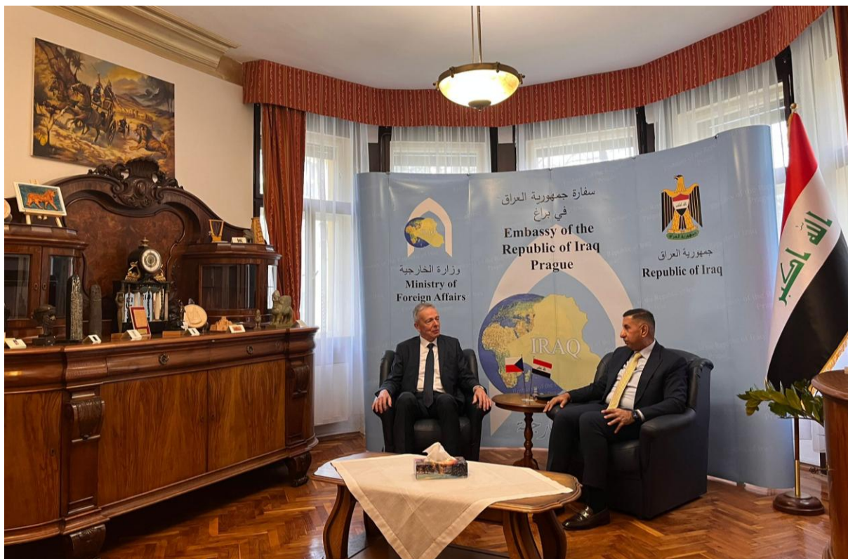
Návštěva iráckého velvyslanectví, 14. 11. 2024