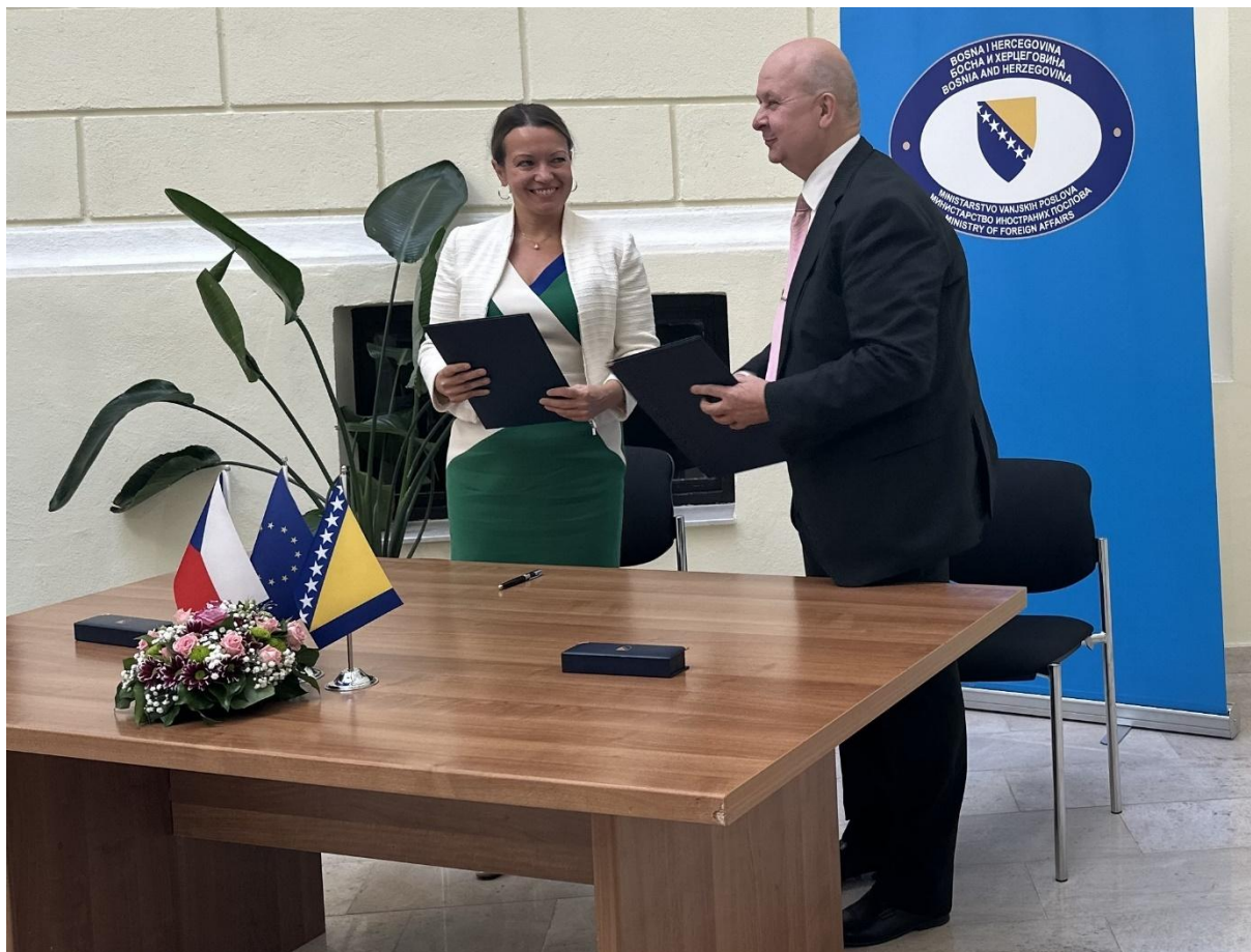
Slavnostní podpis memoranda o spolupráci mezi DA MZV a bosenskou diplomatickou akademií, 10. 10. 2024