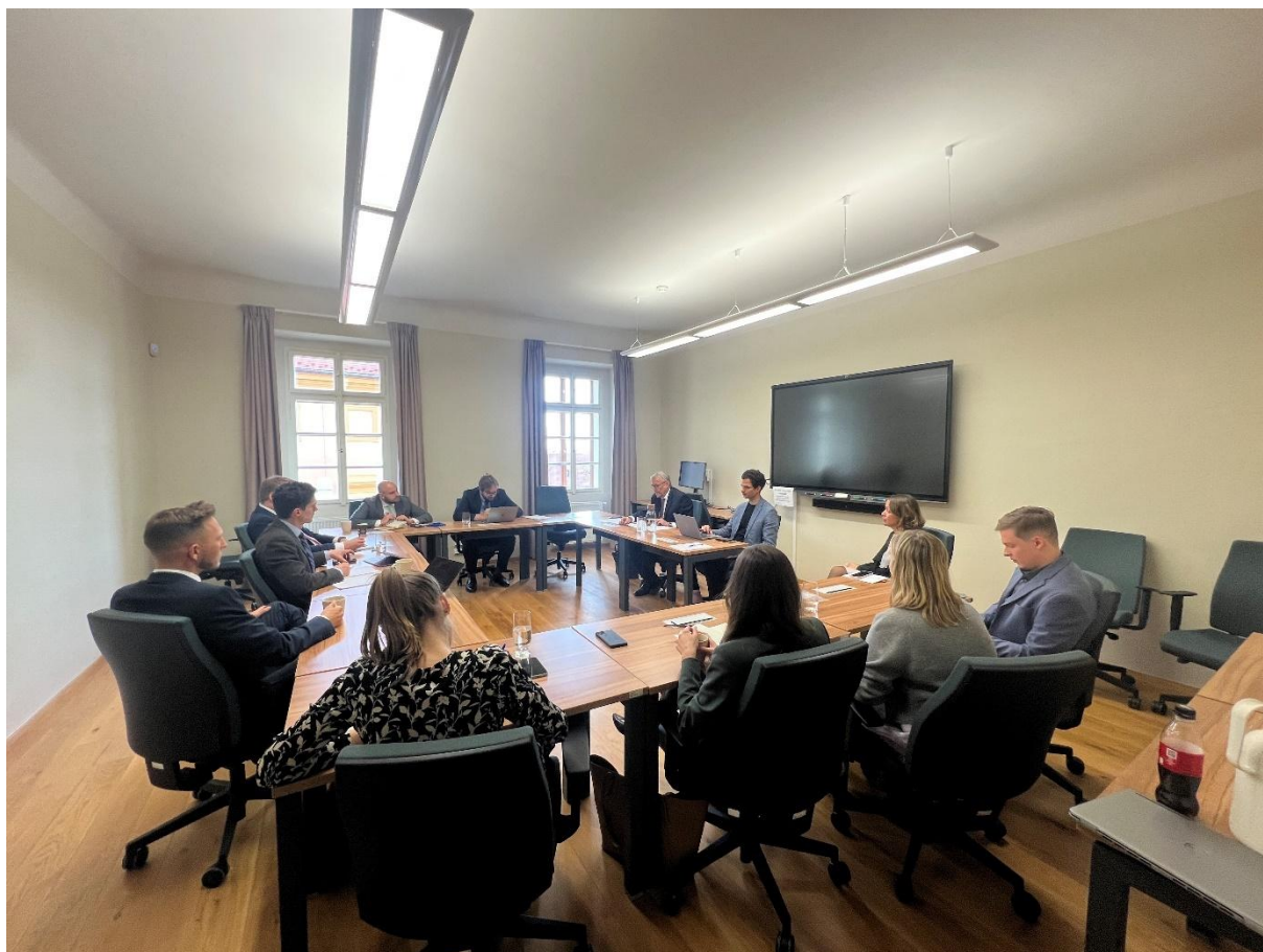
Diskuse s ministrem pro evropské záležitosti Martinem Dvořákem, 22. 10. 2024