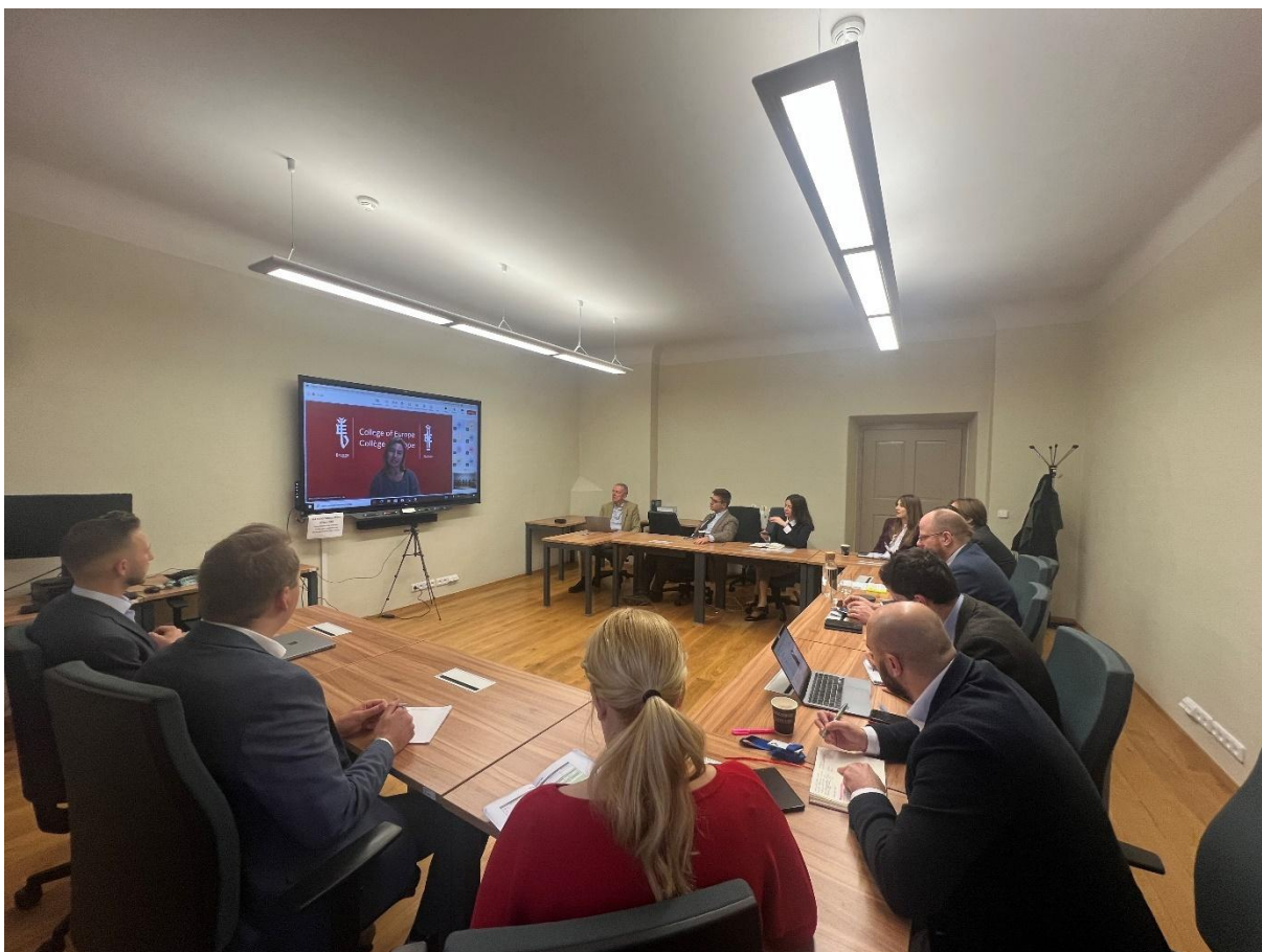
Online přednáška rektorky College of Europe Federiky Mogherini, 9. 12. 2024